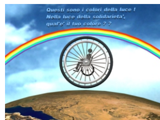
Persone con disabilità