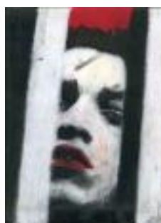
Salute mentale - Abuso e maltrattamento